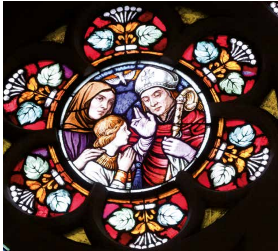
Herz Jesu Kirche Bregenz