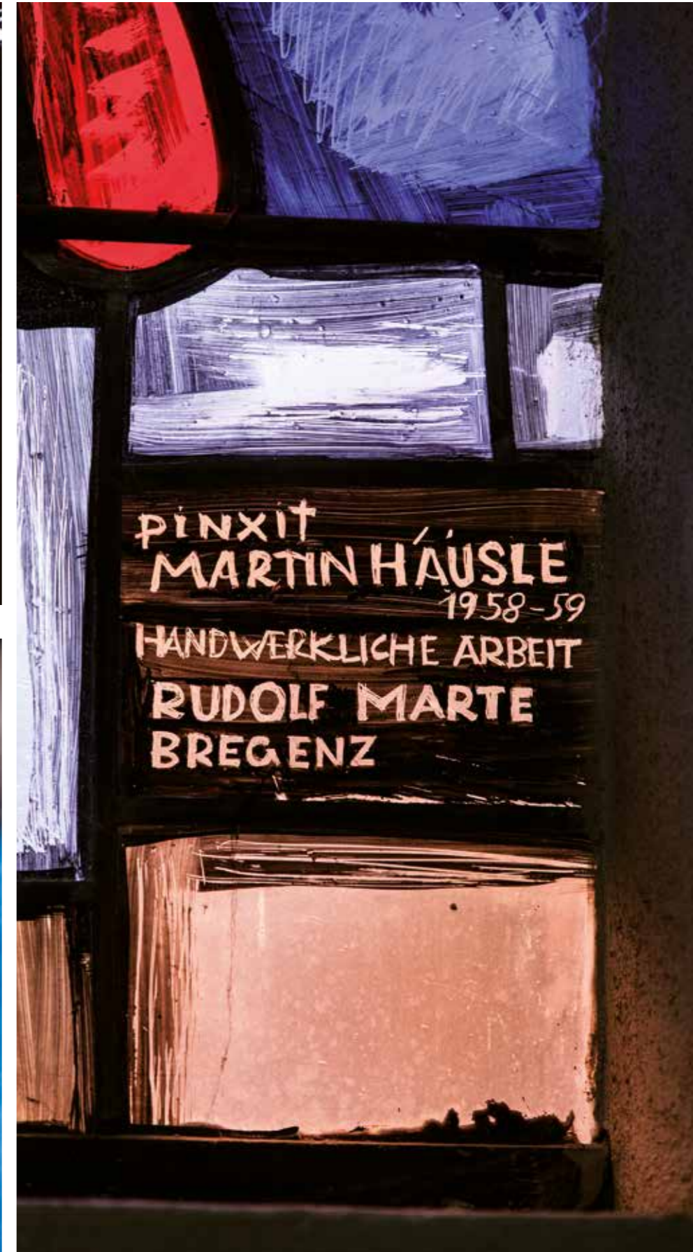
Herz Jesu Kirche Bregenz